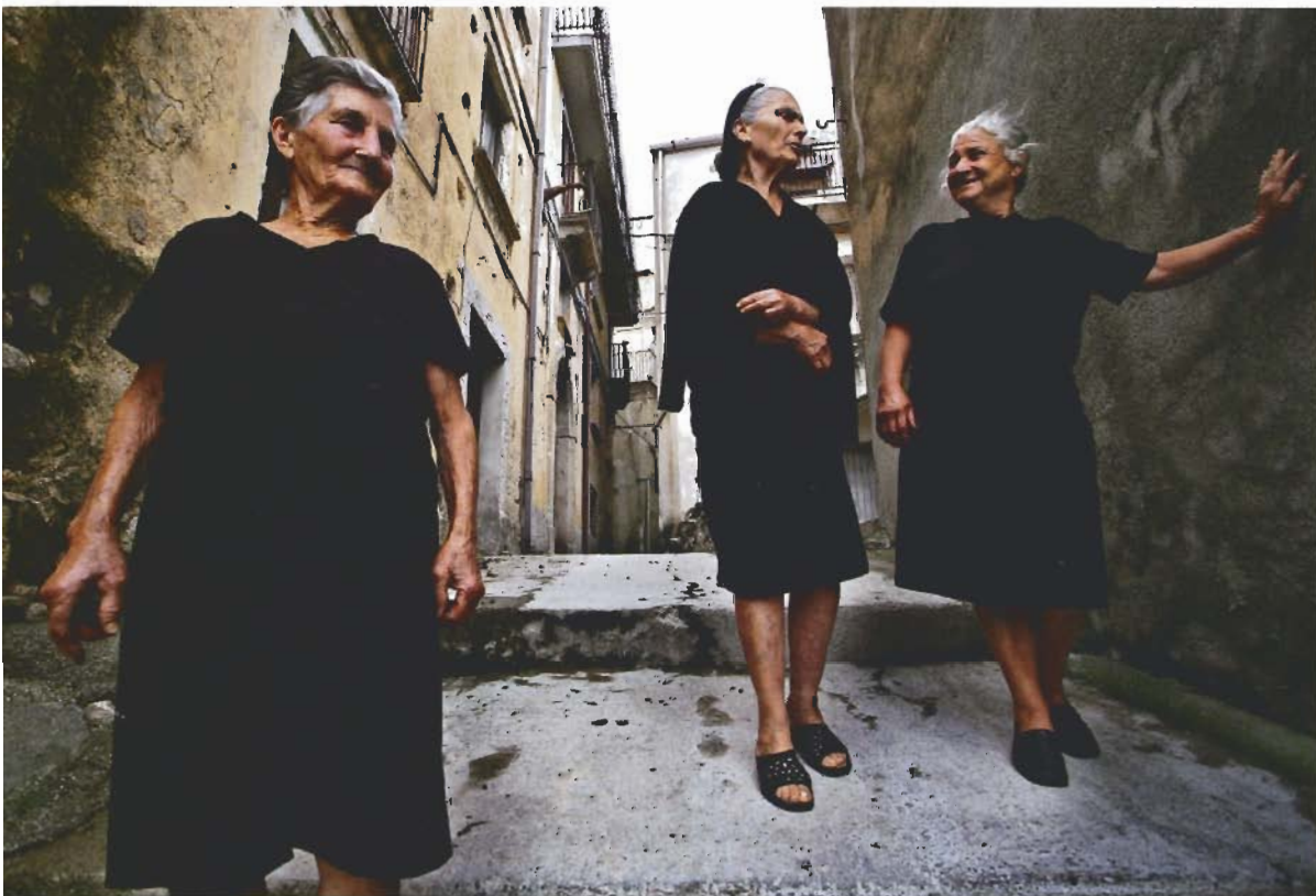
Queste tre signore, vestite rigorosamente di nero, appartengono al nucleo "storico" di Badolato: 400 abitanti che, nonostante le difficoltà, non rinuncerebbero mai alla vita di paese.